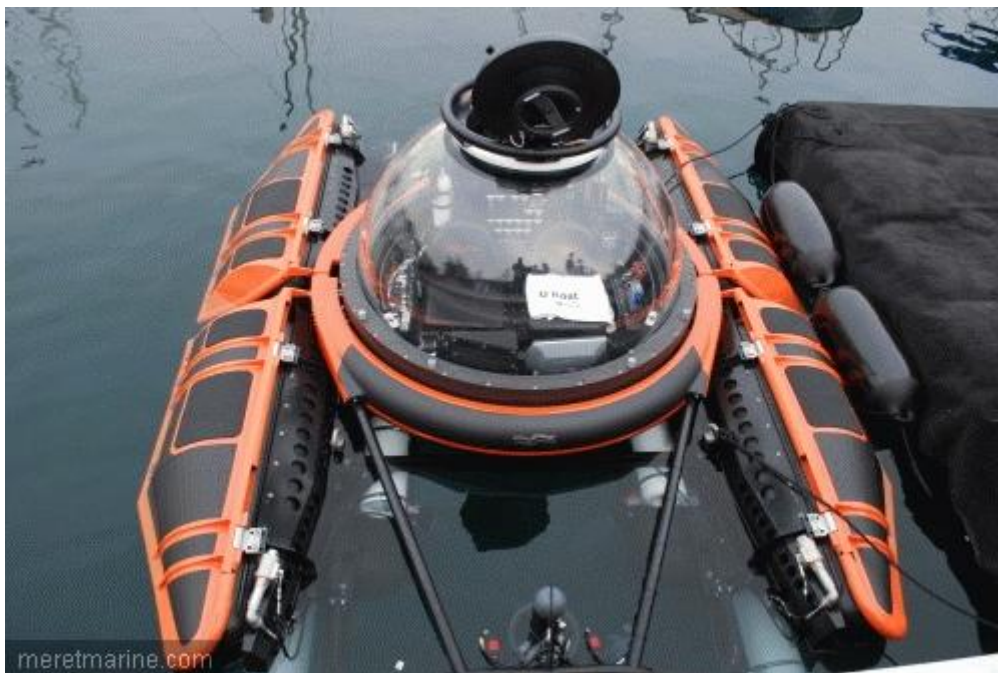
Sous-marin de U-Boat Worx

En dehors de ces tenders, les navires embarquent de nombreux équipements dans leurs garages : jets-skis, kayaks de mer, matériel de plongée et autres scooters sous-marins, comme les Seabob, très prisés actuellement. On trouve même, sur certains bateaux, de véritables sous-marins. Ainsi, la société hollandaise U-Boat Worx, créée en 2005, a développé une série de sous-marins de poche pour les secteurs de l'offshore, de la recherche, mais aussi de la grande plaisance. « Nous avons créé une gamme spécifique. Tous les modèles sont différents, en fonction des demandes des clients. Ils sont conçus pour être intégrés dans un petit espace. Il faut juste une grue pour les mettre à l'eau et les récupérer », explique Charlotte Schroots, directrice marketing d'U-Boat Worx. Pouvant embarquer deux à trois personnes, dont un pilote, le C-Quester peut atteindre une profondeur de 100 mètres, alors que le C-Explorer (1 à 5 personnes), peut descendre de 300 à 1000 mètres, permettant aux occupants de découvrir, derrière un dôme vitré, la beauté des profondeurs marines. Classifiés par le Germanisher Lloyd, ces engins sont commercialisés à partir de 750.000 euros à la vente, mais peuvent également être loués, U-Boat disposant d'une équipe de pilotes professionnels pour la mise en oeuvre.