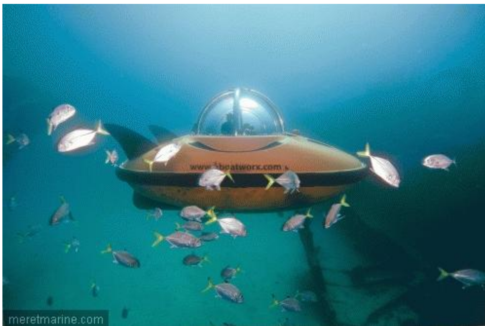
Sous-marin de U-Boat Worx