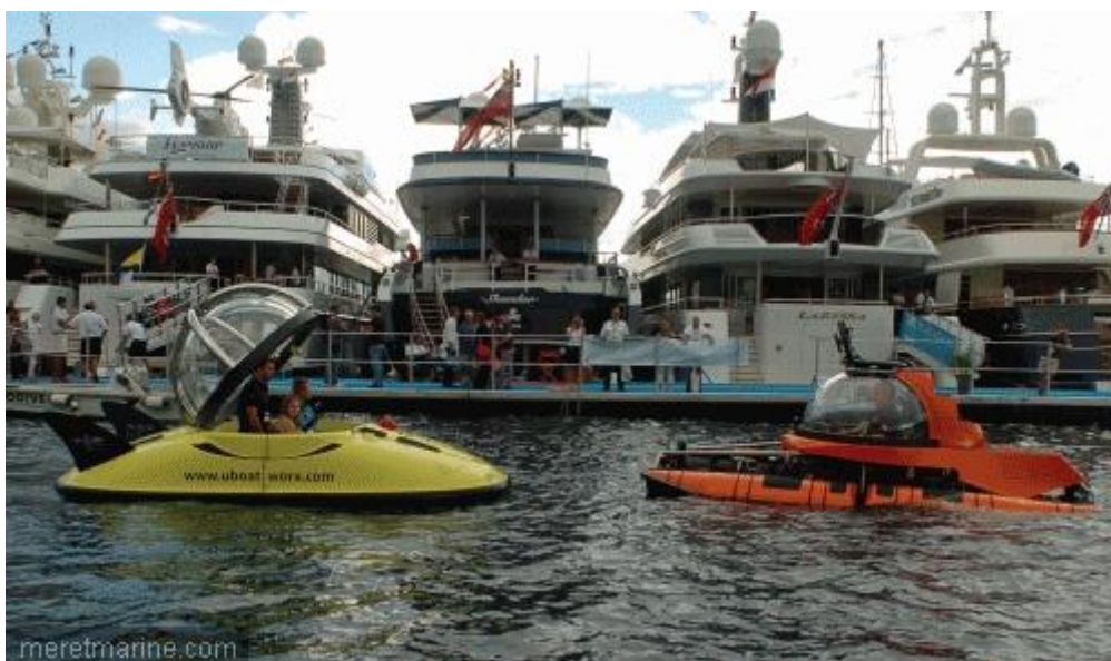
Sous-marins de U-Boat Worx