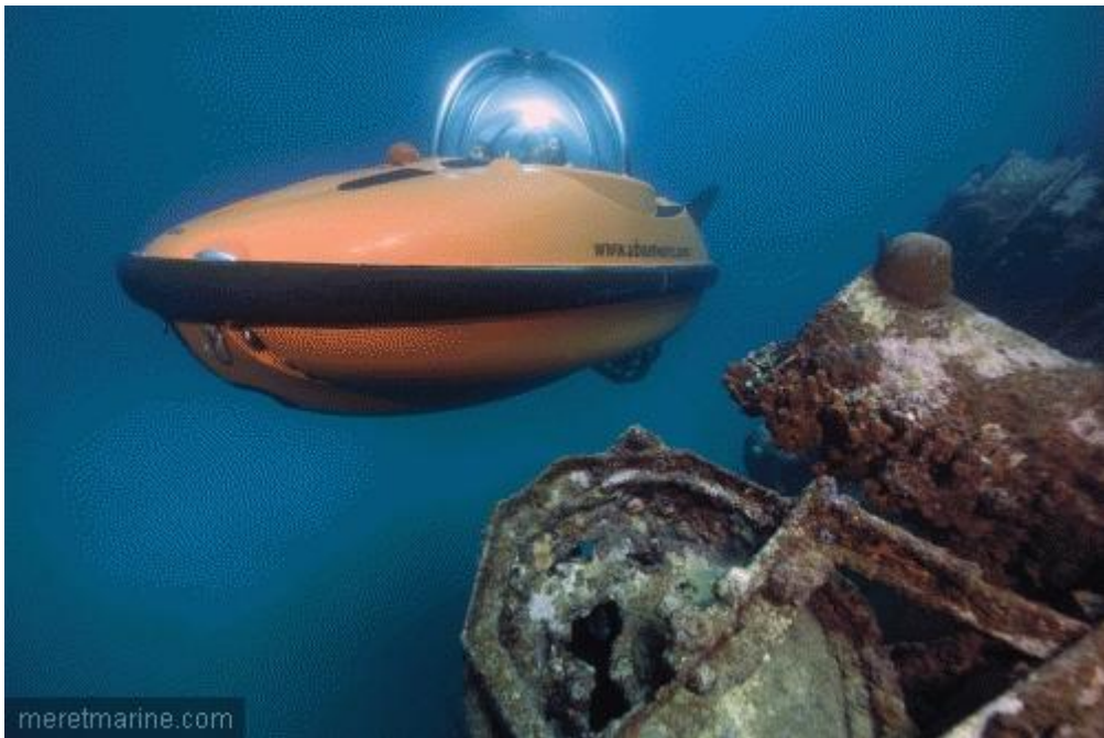
Sous-marin de U-Boat Worx